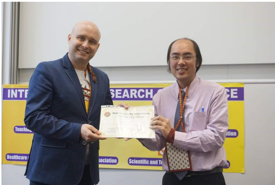
พิธีปิดการประชุมและมอบเกียรติบัตร