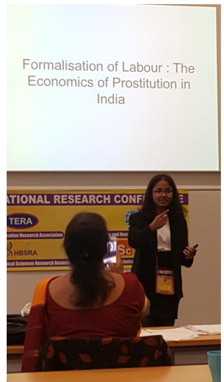
บรรยากาศในห้องประชุมใหญ่