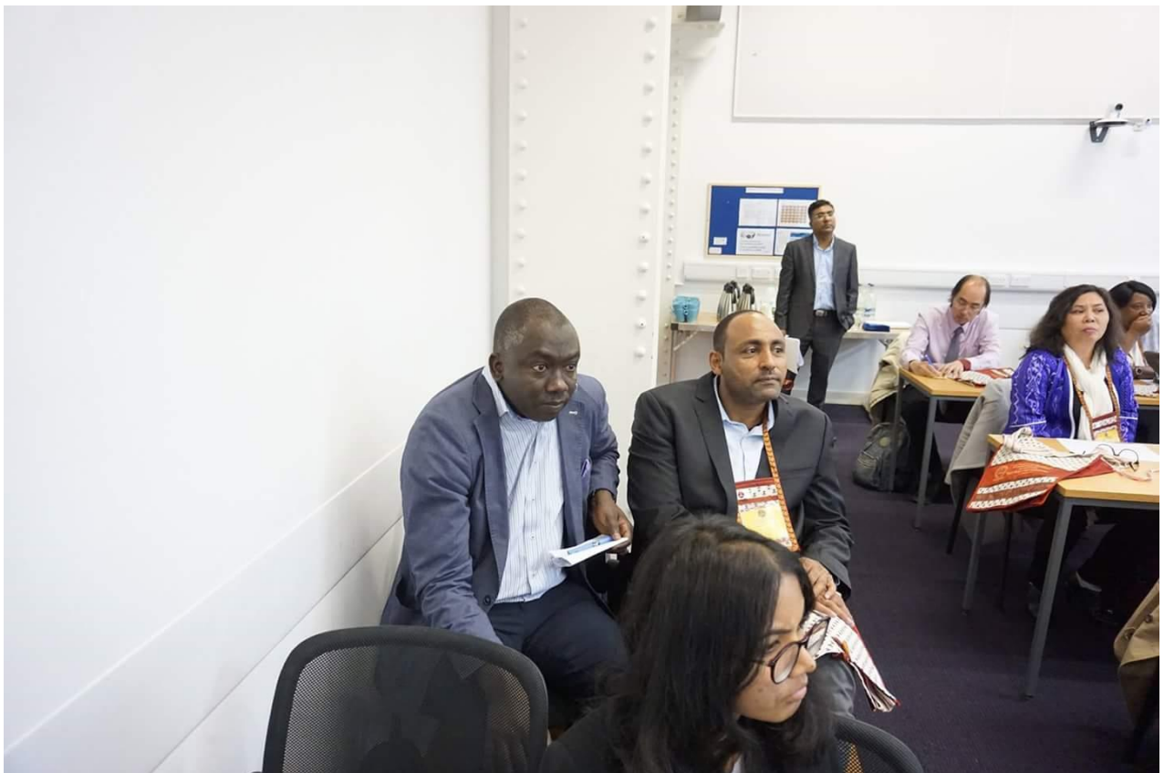
การเปิดโอกาสให้ร่วมอภิปราย